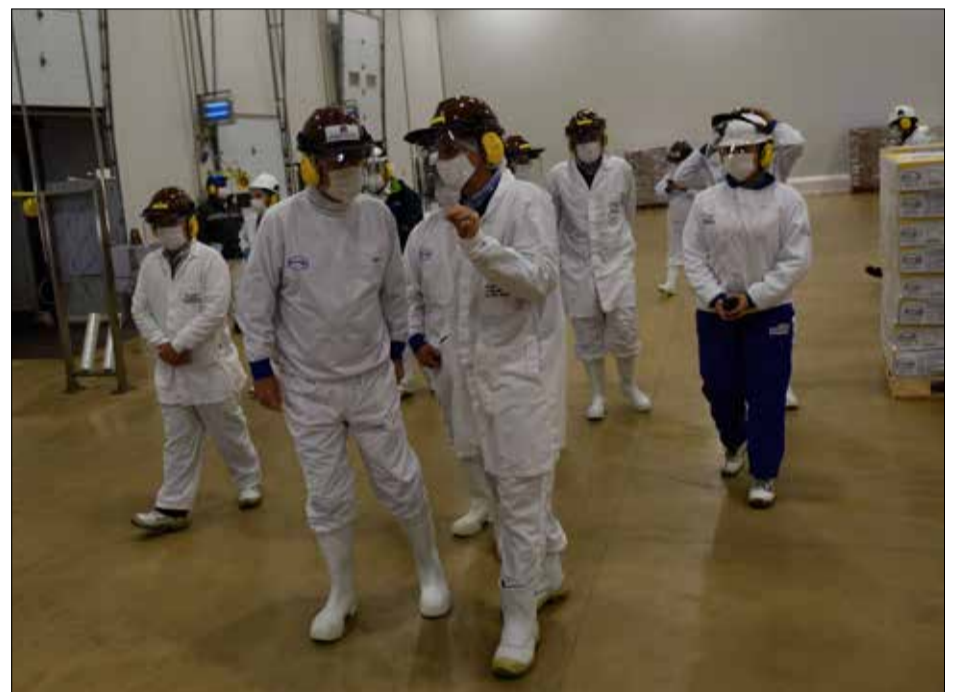
Planta Lo Miranda