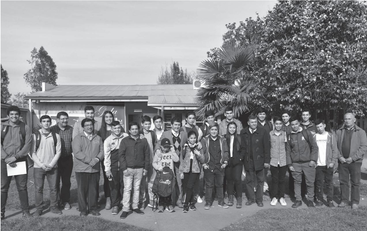
Los deportistas destacados y de proyección de Chimbarongo que recibieron este importante beneficio económico por parte de la Municipalidad son:

Además, en la ceremonia cada uno de los deportistas junto con recibir un diploma y una mochila deportiva. Ellos, agradecieron este gesto, que se proyecta que vaya aumentando en montos y cupos, para los próximos años de la actual administración municipal.