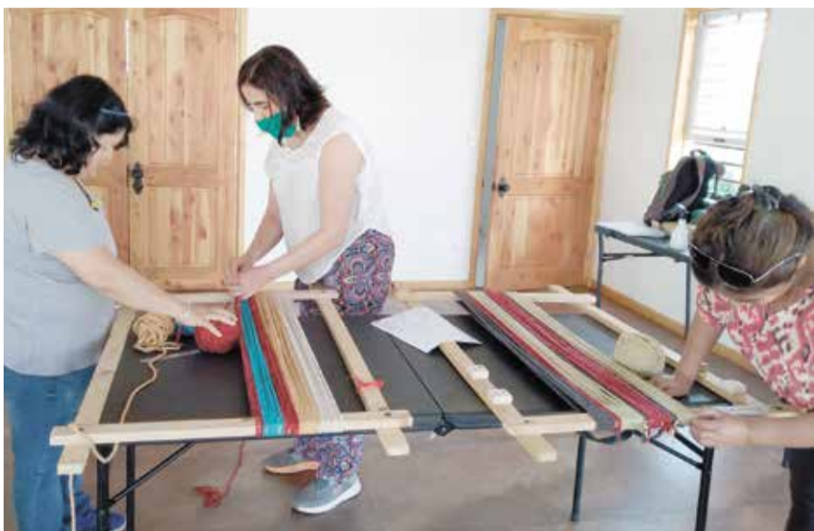
Convenio Indap- Prodemu